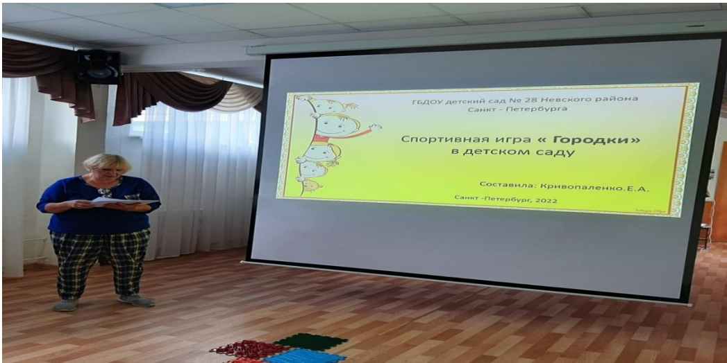
Консультация для педагогов «Спортивная игра Городки в детском саду»