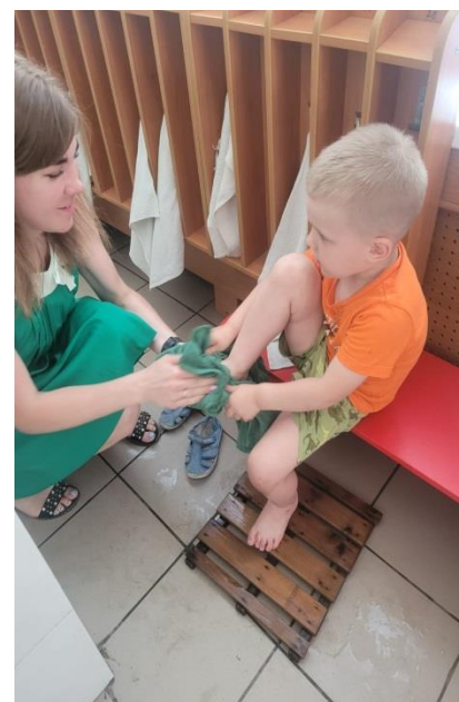
Семинар – практикум для воспитателей «Закаливающие процедуры летом»