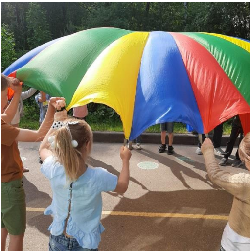
Тематическое физкультурное занятие для детей старшей группы с использованием парашюта