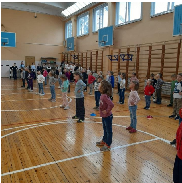
Экскурсия в школу №26 и посещение спортивного зала